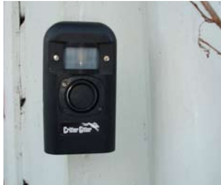
«Crittter Gitter» monteres slik at dyrets bevegelser utløser skremselslyd.