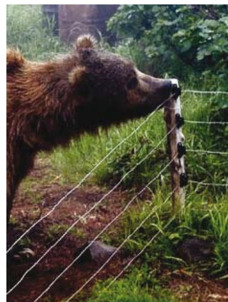
Strømmerder kan gi effektiv beskyttelse mot bjørneskader.

Tradisjonelle metoder for å beskytte bikuber fra bjørn før strømmerder ble tatt i bruk, var å stille kubene høyt opp på et steinfundament eller gjerde dem inn med stein eller andre typer inngjerdingsmaterieil. Enkelte steder i Europa og Nord-Amerika bygger man bl a plattformer for kubene, for å gjøre dem utilgjengelige for bjørn. En slik plattform må være minst tre meter høy (husk at den skandinaviske brunbjørnen kan bli 280 cm lang). Om stolpene som plattformen hviler på er laget av treverk eller trestammer, må disse dekkes over med stålplater for å hindre at bjørnen klatrer opp. En stige gjemmes i nærheten og brukes for selv å komme til kubene.