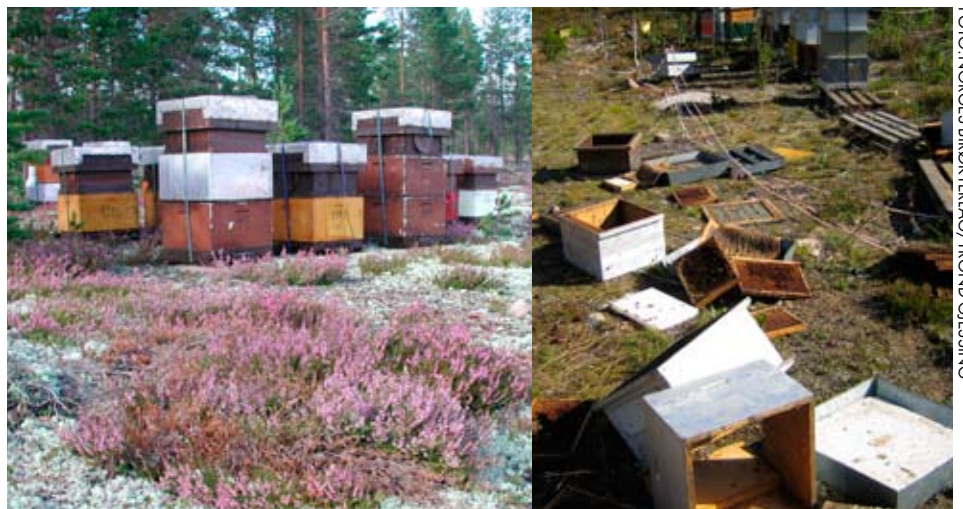
Vandrebirøkt er spesielt utsatte for skader der bjørn forekommer.

Direktoratet for naturforvaltning har satt en standard for oppføring og vedlikehold av elektriske gjerder til rovviltsikring, utarbeidet av Norsk viltskadesenter ved Bioforsk Tjøtta ( www.viltskadesenter.no ). Når det gis tilskudd til inngjerding av vandrebigårder, vil Fylkesmannen sette som vilkår for tilskuddet at oppsettingen gjennomføres i henhold til den fastsatte standarden, eventuelt med lokale tilpasninger. Du kan selvsagt benytte andre tiltak, dvs alternative strøm Gjerdeløsninger, men husk at slike tiltak