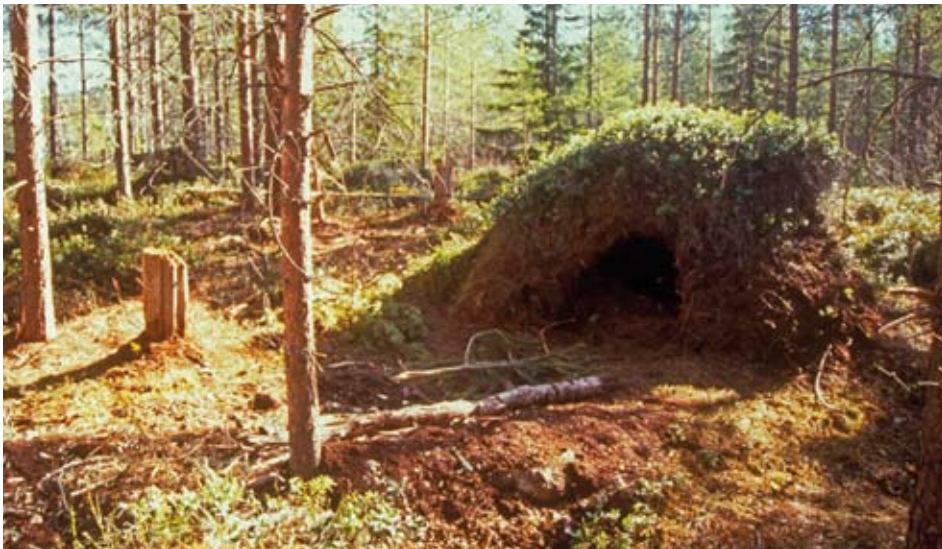
Utgrävt ide i en gammal myrstack.